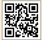
학교폭력 실태조사 시스템 바로가기